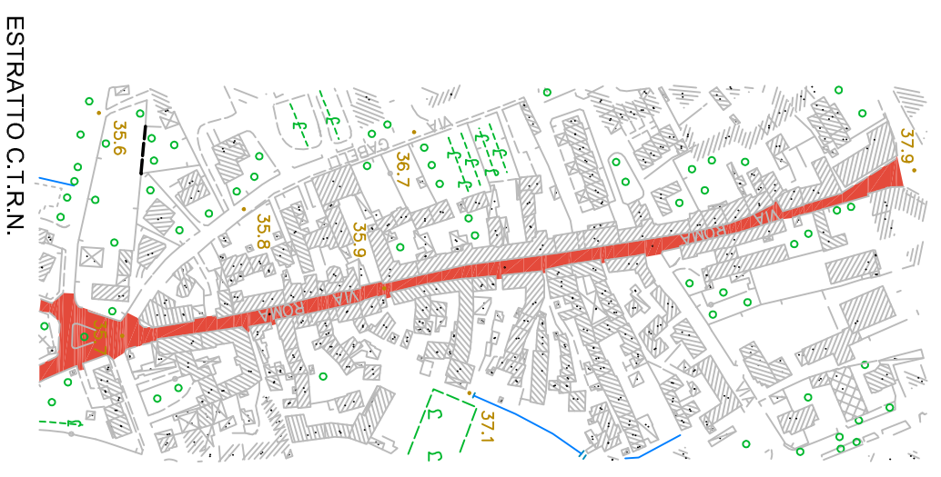
ESTRÀTTÒ C.T.R.N. SCALA 1:5000