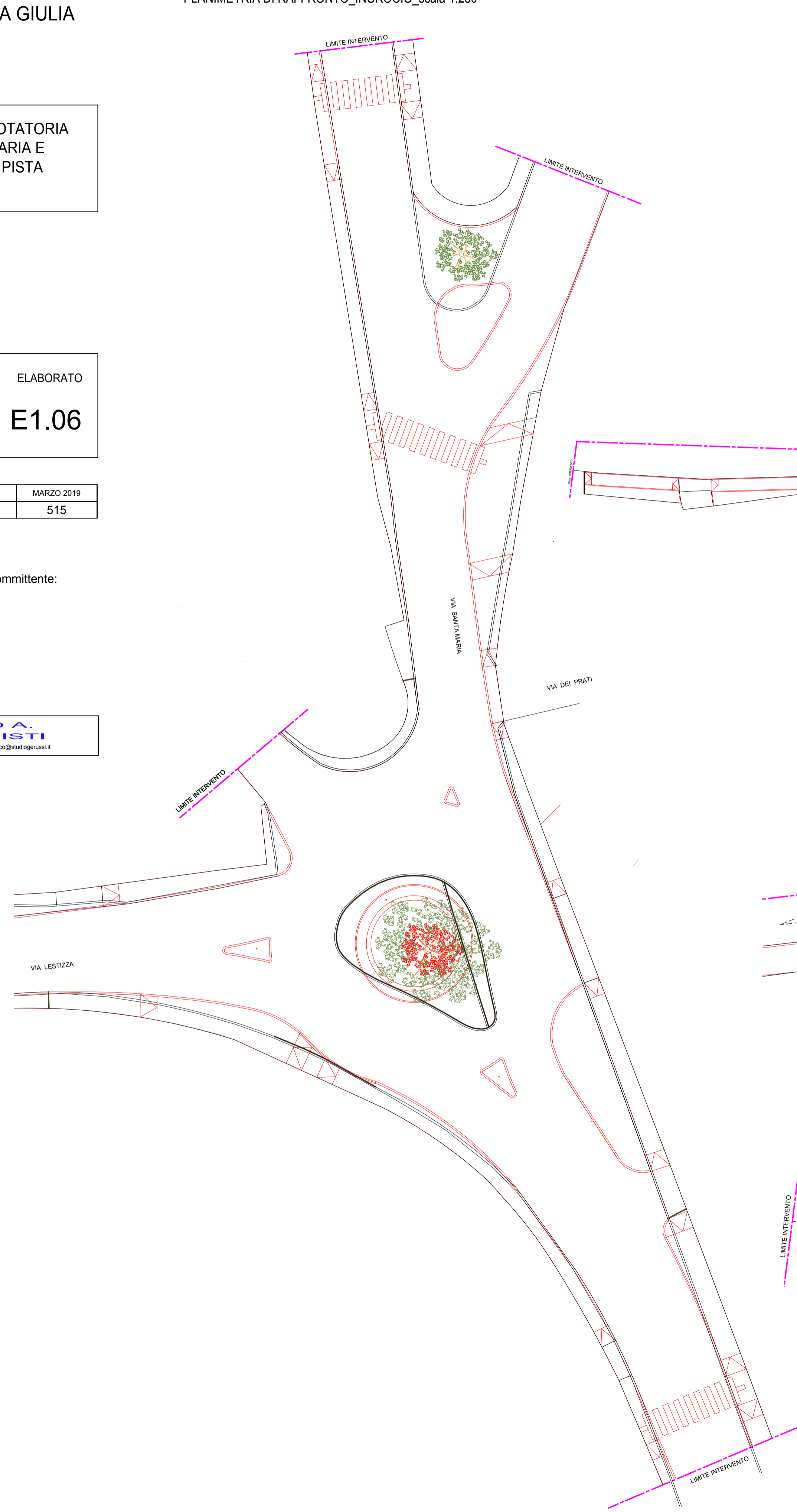
PLANIMETRIA DI RAFFRONTO_INCROCIO_scala 1:250